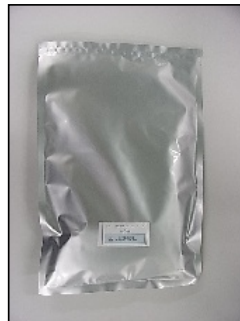
←アルミ袋包装 (窒素ガス封入)

* 標準梱包: 20リットルペール缶に25kg入り (小分けアルミ包装は別途特注にて承ります)。