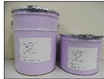
左: 20リットルペール缶