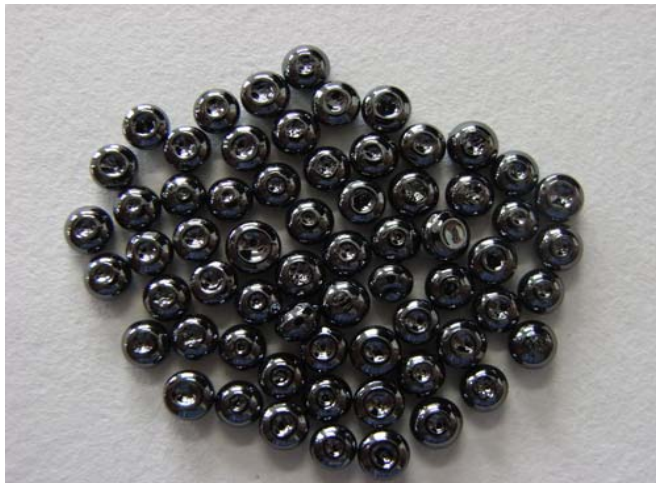
ウェットショット 写真

* 標準梱包形態: PE袋に窒素ガスパージの上、25kgペール缶にて梱包、出荷しています。